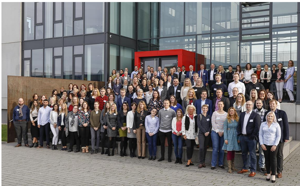
Gruppenfoto Mitarbeiter lohn-ag.de AG, November 2019