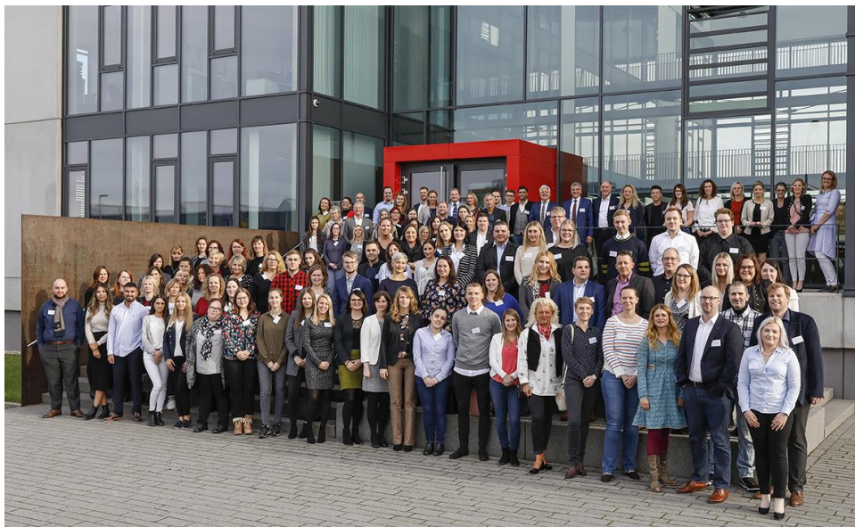
Gruppenfoto Mitarbeiter lohn-ag.de AG, November 2019